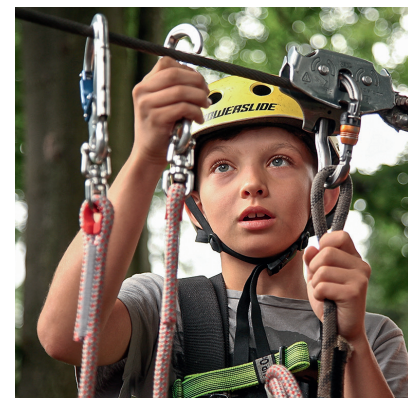
Ausflüge in Kletterpark oder Zoo